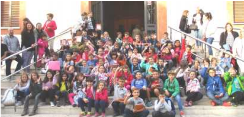
Final de curs amb els nens i nenes de segon any.