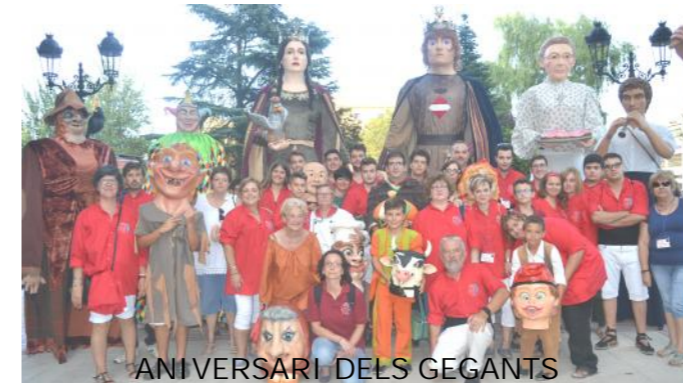
ANIVERSARI DELS GEGANTS