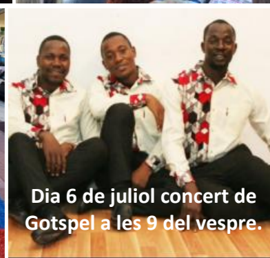
Dia 6 de juliol concert de Gotspel a les 9 del vespre.

DIA 24 FESTA MAJOR DE SANT JOAN Ofici solemne a Sant Joan a les 11h.