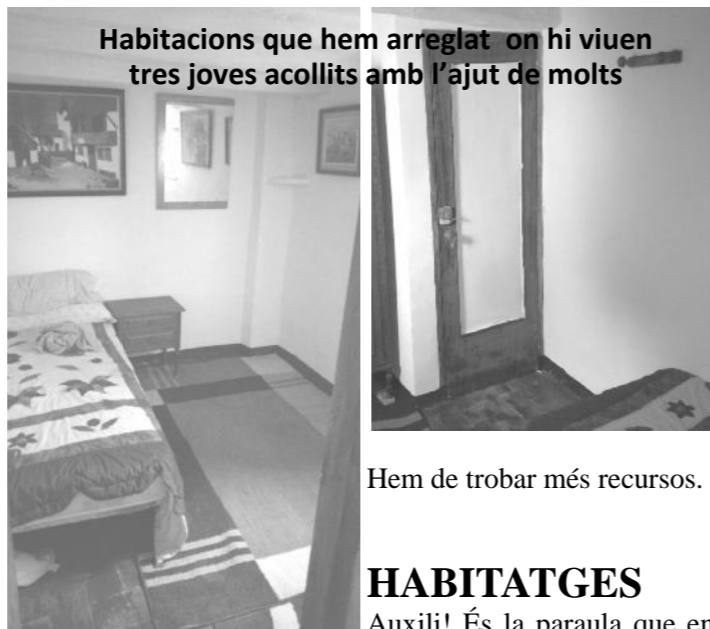
Habitacions que hem arreglat on hi viuen tres joves acollits amb l'ajut de molts

Arreu podem fer moltes coses, arreu hi ha projectes diversos, però arreu i qualsevol projecte només pot funcionar si hi ha persones. Necessitem algunes persones més per col·laborar amb el voluntariat de La Taulada, segons allò que cadascú sap fer. Important un equip, per ajudar al acompanyament de persones amb la seva problemàtica, com acompanyar-los als serveis socials, a arreglar papers i documents, a cercar allotjament, treball que ningú no n'ofereix cap. Hem de ser més colla per poder fer aquestes coses.